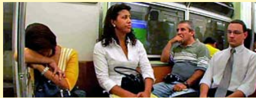
Typische samba-fete in der u-ban von Sao Paulo